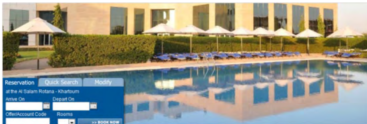
Al Salam Rotana Hotel, Khartoum